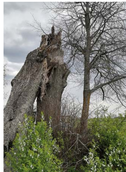
Dižliepu alejas jaunā paaudze.

pagasta kultūrvēstures apzināšanai, ceļš vedīs uz Veckalsnavu, kur pabūsime baznīcas teritorijā, pie Veckalsnavas muižas dzirnavām un izbaudīsim dižliepu alejas sniegto ēnu. Ceļš visā maršruta garumā mainīsies – grantēts, smilšains, asfaltēts, tāpēc dalībniekiem jāpievērš uzmanība drošībai – gan personīgajai, gan satiksmes. Ir paredzēts laiks un vieta līdzpaņemtajām pusdienu maizēm. Ceļš turpināsies līdz Teteru dižozolam, tad uz mūsu pagasta centru, Arborētuma teritoriju, būs iespēja aplūkot vēsturiskās Jaunkalsnavas muižas teritorijā