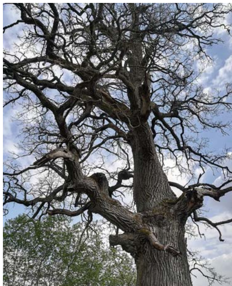
Teteru milzis maija sākumā.

Šogad akcents uz dabas objektiem – kokiem, dižkokiem, upēm – to kopšanas un uzturēšanas nepieciešamību. Brauciens sāksies plkst. 10.00 no kempinga „Upesmalas”, kur būs iespēja atstāt mašīnas, iepildīt dzeramo ūdeni, sakārtot velotehniku braucienam. Ar nelielām pauzēm elpas ievilkšanai un arī