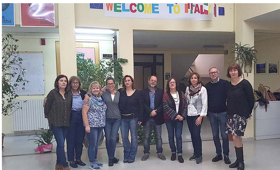
Skolu pārstāvju tikšanās Itālijas pilsētā Corato.

Ir pagatavoti un nosūtīti projekta partnerskolām arī Ziemassvētku našķu paraudziņi ar pievienotām receptēm. 2. klases skolēni pagatavoja brīnumgardu saldo desu, bet septītās klases skolēni, apgūstot tematu par tradicionālajiem ēdieniem, angļu valodas stundā gatavoja latviešu konfekti „Gotiņus”, ko papildināja ar dažādām sēklām un riekstiem.