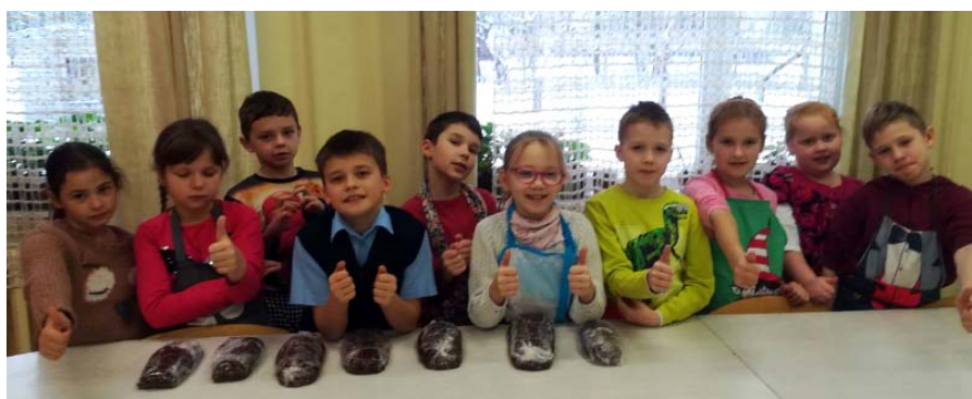
Skolēni gatavo saldumus partnerskolām.