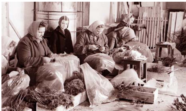
Koku potēšanas sezonas sākums

Runājot par grāmatām, Kalsnavā šogad iznākusi Dzidras Lapsas