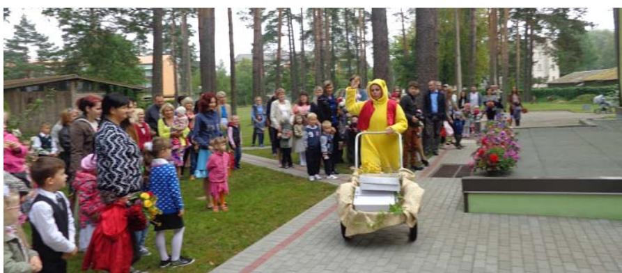
Kalsnavas PII „Lācītis Pūks” uzsākuši jauno mācību gadu kuplā pulkā – 4 grupās mācās 92 bērni. Pie bērnu dārza arī šogad plīvo Eko skolu programmas Zaļais karogs.