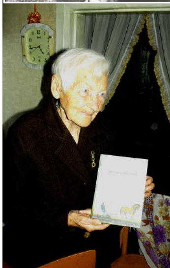
Dz. Lapsa šogad izdevusi savu atmiņu grāmatu GRANTSKALNU STĀSTI