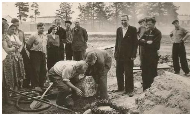
Kalsnavas spirta rūpnīca