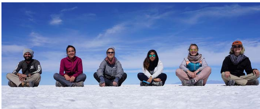
Mūsu Uyuni sāls tuksneša ceļojuma grupa Bolīvijā.