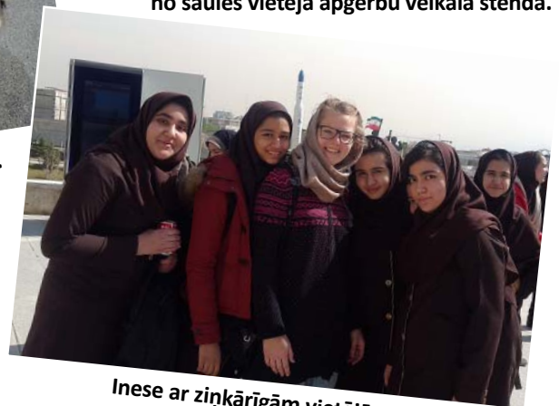
Inese ar ziņkārīgām vietējās skolas meitenēm Teherānā, Irānā.

ko mazliet paņēmām līdzī fotogrāfijās un protams savās atmiņās. Nevar tā visu izstāstīt un aprakstīt, tas pašam ir jāredz un jājūz, jo katrs redz kaut ko savādāk un redzētais liek justies atšķirīgi, bet mazu ieskatu gan varam nodot papildinot šo stāstījumu ar fotogrāfijām no dažām vietām. Vēl daudz kur nav būts, bet vajag arī mazliet atelpu. Nenoliekam malā ceļošanu, turpināsim, kad būs laiks un jaunas