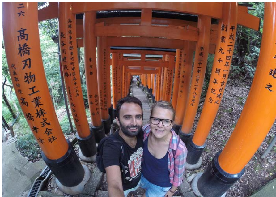
Fushimi Inari Shrine Kioto, Japānā.