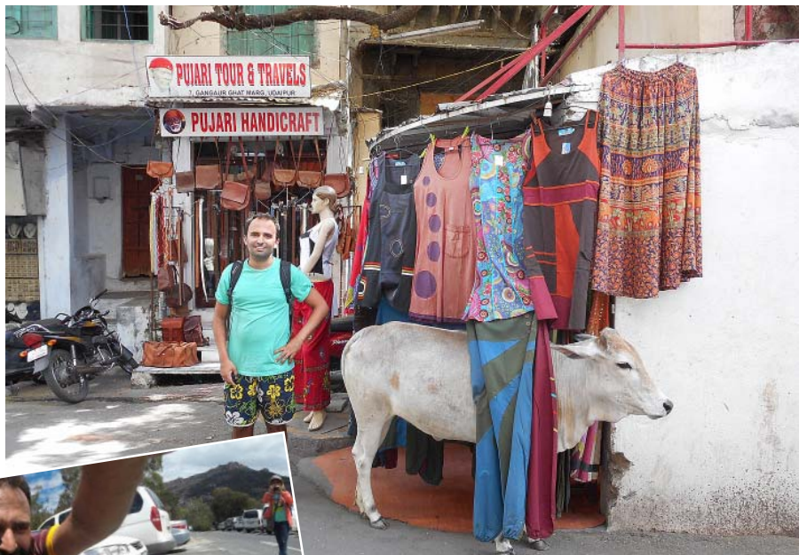
Migels ar svēto govji Udaipurā, Indijā. Tur viņām ir atļauts darīt visu, arī paslēpties no saules vietējā apģērbu veikala stendā.