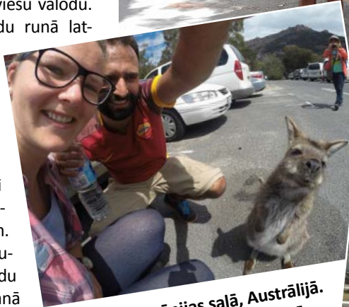
Tasmānijas salā, Austrālijā. Ziņkārīgs savvaļas volabijs atnāca apvaicāties, vai mums nav kāds našķis.

ko mazliet paņēmām līdzī fotogrāfijās un protams savās atmiņās. Nevar tā visu izstāstīt un aprakstīt, tas pašam ir jāredz un jājūz, jo katrs redz kaut ko savādāk un redzētais liek justies atšķirīgi, bet mazu ieskatu gan varam nodot papildinot šo stāstījumu ar fotogrāfijām no dažām vietām. Vēl daudz kur nav būts, bet vajag arī mazliet atelpu. Nenoliekam malā ceļošanu, turpināsim, kad būs laiks un jaunas