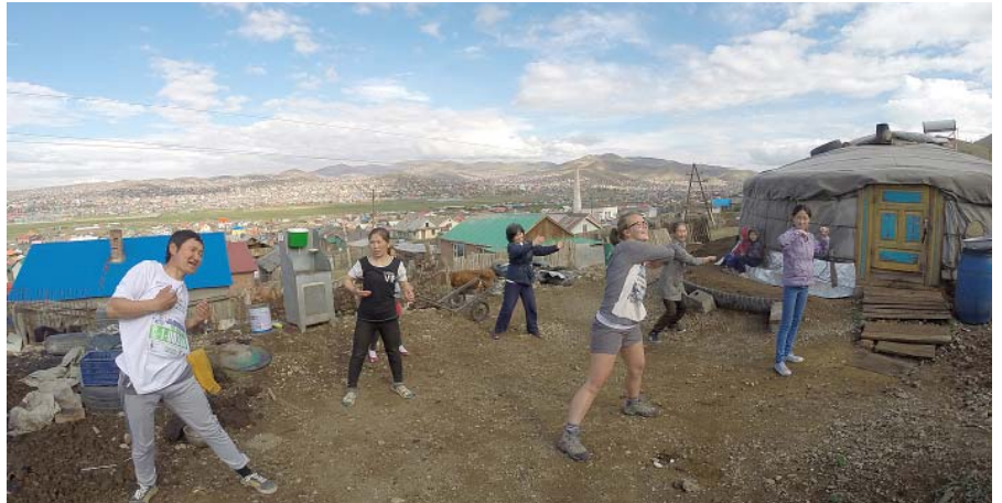
Rīta rosme ar vietējo ģimeni no Ulanbatoras nabadzīgā rajona, Mongolijā.

Sākām tepat ar Eiropas valstīm, tad virzoties uz Āzijas valstu pusi, pabijām Japānā, Mongolijā, Indijā, Indonēzijā. Ir pabūts Amerikas kontinentā, Austrālijā, jau minētajā Jaunzēlandē. Arī mazas trakulības atļāvāmies, kur nu bez tā, lietas, ko dzīvē neizbaudītu nekad, bet tad aiziet. Katra vieta apbūra ar savu skaistumu,